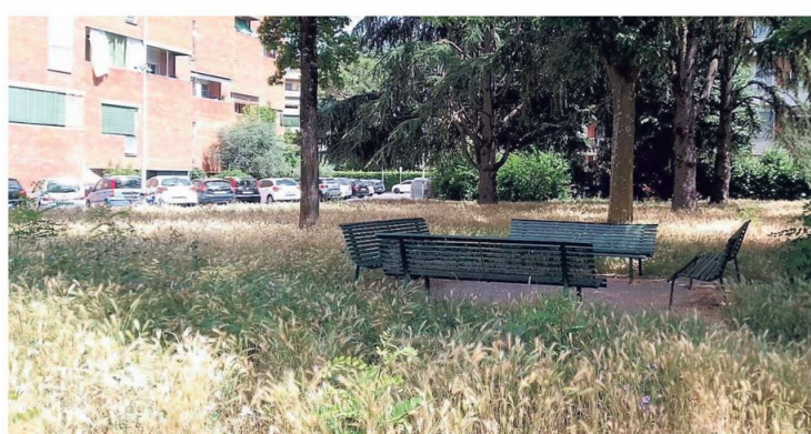
▲ Argingrosso Nei giardini di via Michetti l'erba alta circonda le panchine